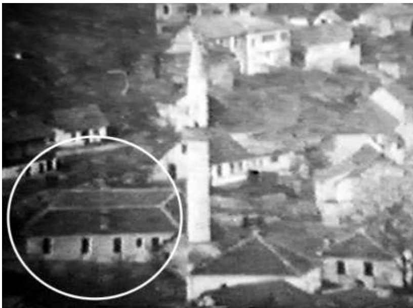
Zgrada medrese nakon adaptacije 1945.

Za vrijeme rata u zgradu medrese se uselila milicija talijanske vojske, koja se 1942. godine pod naletom partizana raspršila, a u zgradu se uselili muhadžiri. U tom periodu je zgrada veoma oštećena. Nakon 1945. godine zgrada je nabrzinu adaptirana i pretvorena u poslovnu, a kasnije u stambenu zgradu. Godine 1958. država je nacionalizovala (oduzela) zgradu medrese od Islamske zajednice i time joj onemogućila da medresu koristi za svoje potrebe.