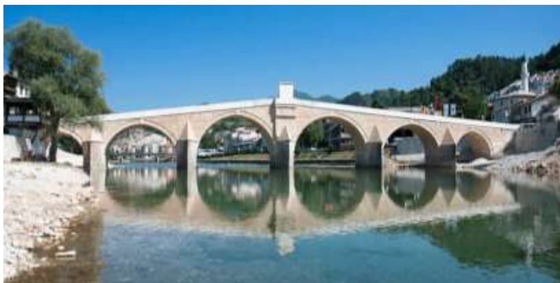
Sagrađen 1682. Porušen 1945.g - obnovljen 2006.g