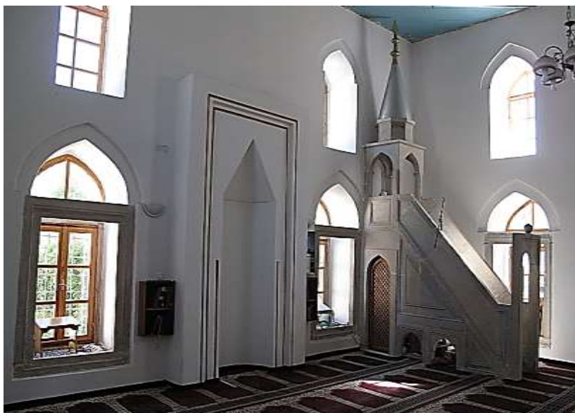
Mihrab i minber