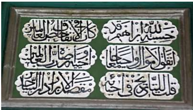
Natpis iznad ulaznih vrata u džamiju